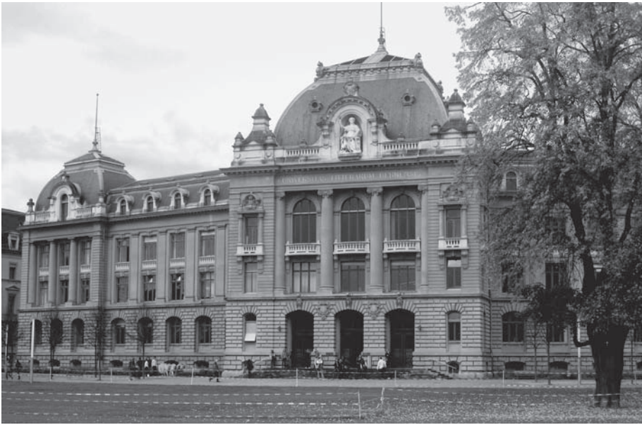
Ab 1873 Carl Hiltys Wirkungsort als Staatsrechtsprofessor: die Universität Bern.