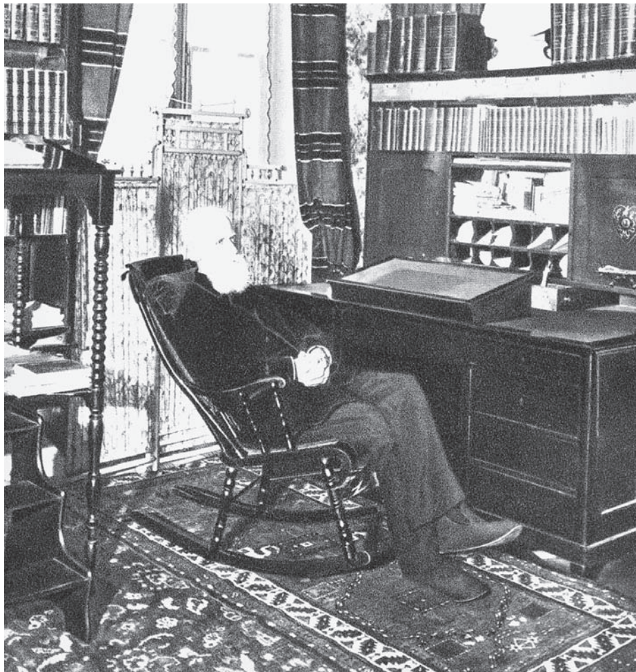
Carl Hilty in der Zurückgezogenheit der letzten Lebensjahre.

Interessant scheint zunächst, wie sehr uns – und dies ist eine vielleicht unerwartete Perspektive – die Gestalt und das Werk Hiltys an das Geistesleben Amerikas , vor allem Neuenglands, im